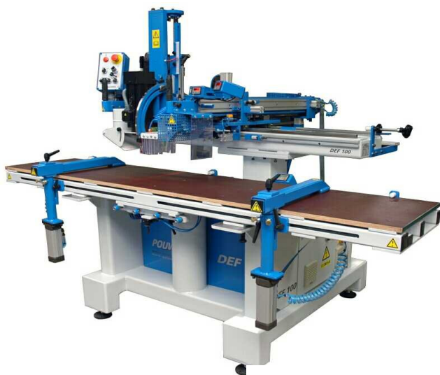
DEF 100 Syrio