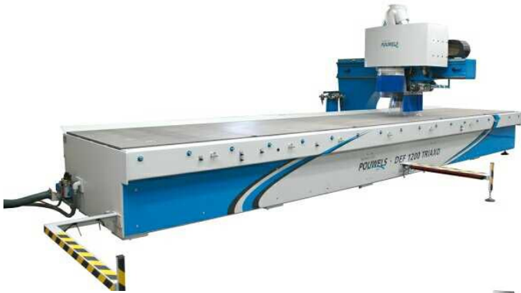
CNC 1200 Traxio