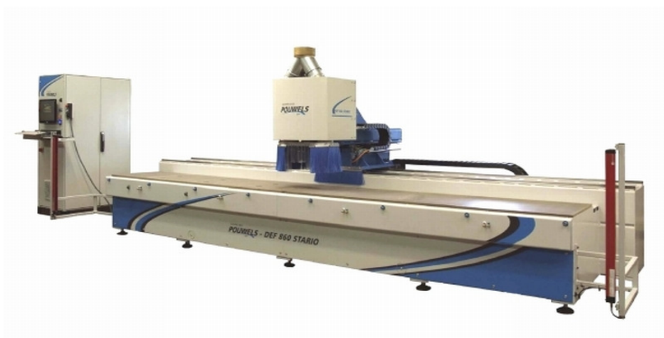
CNC 860 Stario